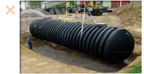
Réserve citerne hors-sol