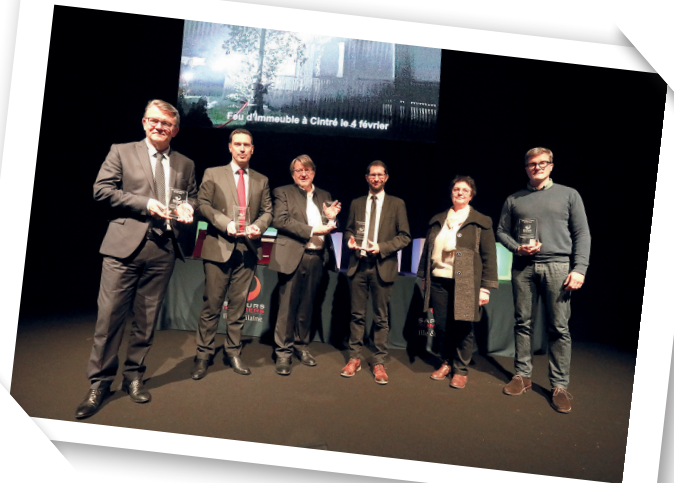
➤ Remise de prix aux employés citoyens, lors de la cérémonie des vœux du SDIS

Un SPV conventionné est sollicité en moyenne 14 heures par an sur son temps de travail pour partir en intervention.